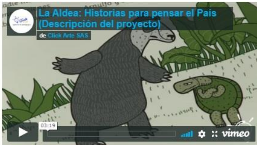
La Aldea from Click Arte SAS on Vimeo.

Cada viernes, desde el 7 de octubre hasta el 25 de noviembre, La Aldea circulará con la edición impresa de El Espectador . Esta es una serie de ocho historias coleccionables para niños realizada por Colombia2020 , en asocio con la Unión Europea y con el apoyo de La Conversación Más Grande del Mundo, el Programa de Naciones Unidas para el Desarrollo (PNUD), Isagén, el Alto Comisionado de Naciones Unidas para los Refugiados (Acnur) y la Cámara de Comercio de Bogotá.